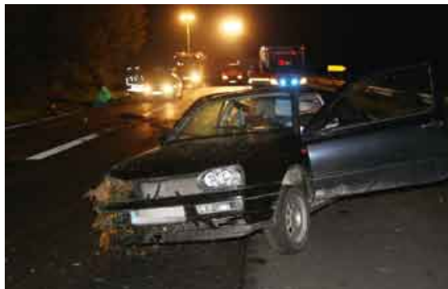
Verkehrsunfall auf B426