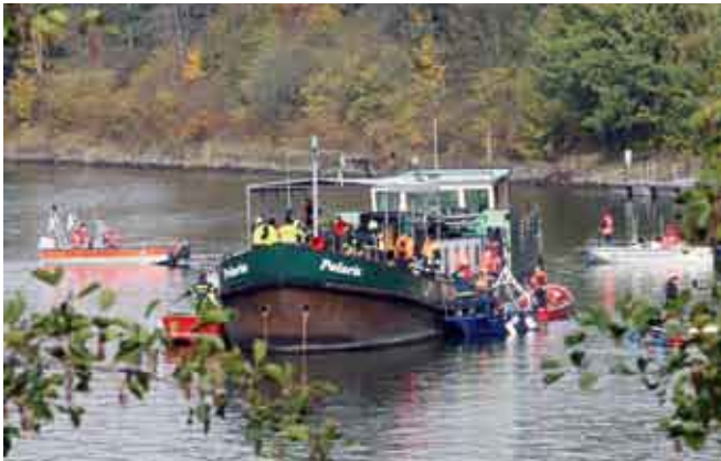
KatS-Übung im Hafen Erlenbach