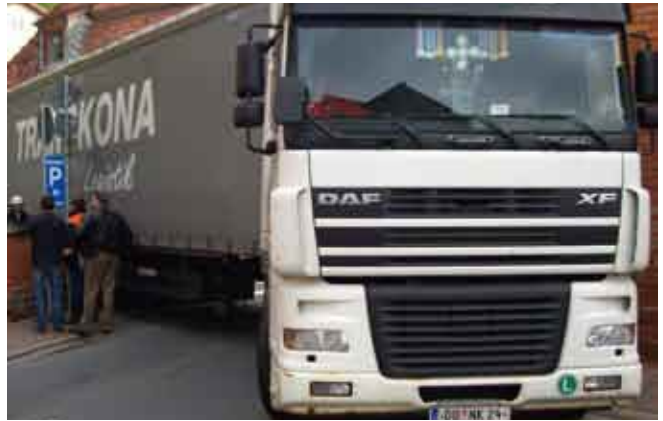
Eingeklemmter LKW in der Lindenstraße