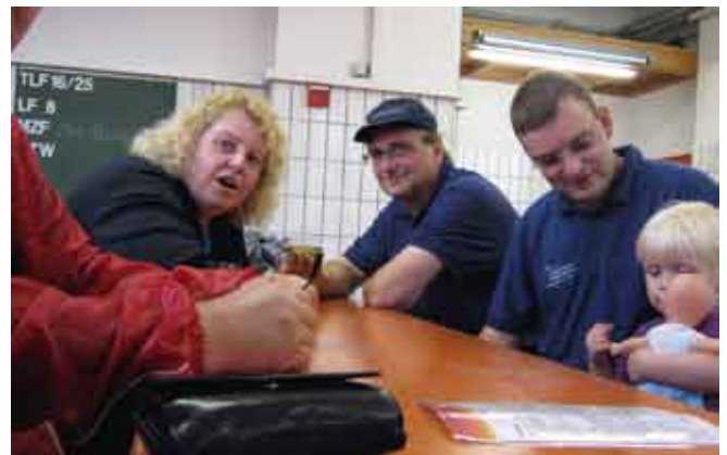
Picknick FF Eisenbach