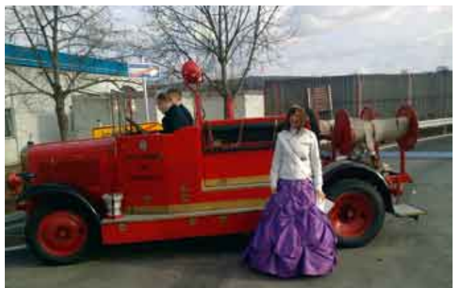
Eröffnung Kreisel Römerstraße/Berufsschulstraße