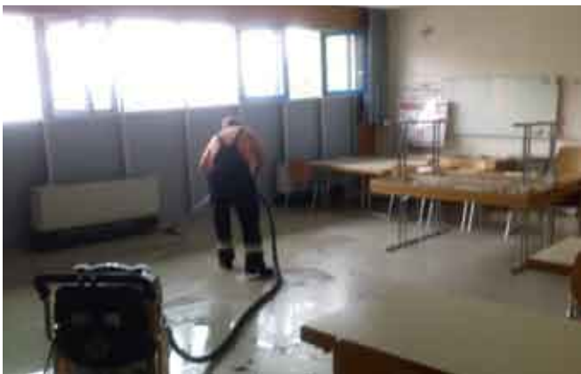
Unwettereinsatz im eigenen Haus