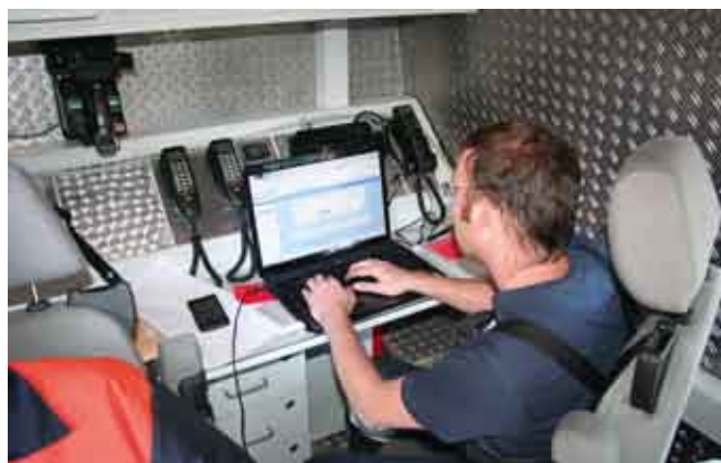
Stabsrahmenübung im Landratsamt