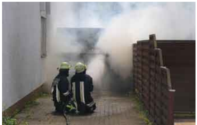
Garagenbrand in Eisenbach