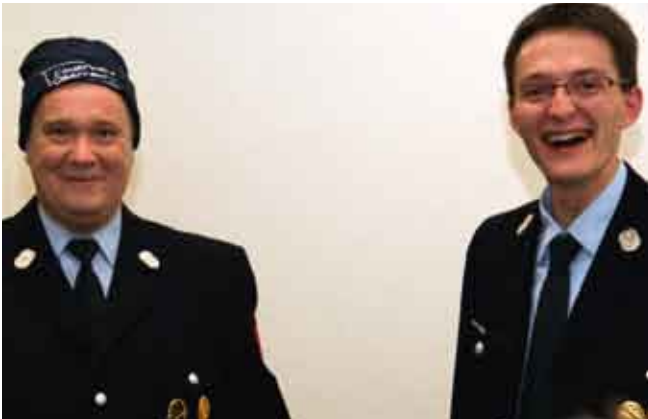
Wintermütze auf dem falschen Kopf?