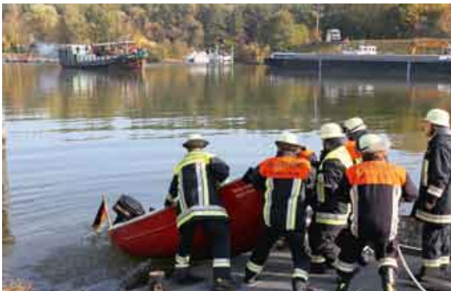
KatS-Übung im Hafen Erlenbach