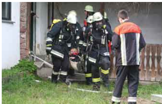
Löschübung am Brückenkopf Trennfurt