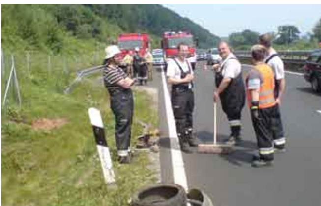
Verkehrsunfall auf B469 - Fahrtrichtung Amorbach