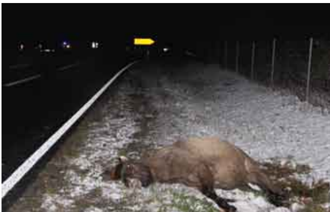
Verunglückte Pferde auf B469 zwischen Oberburg und Wörth