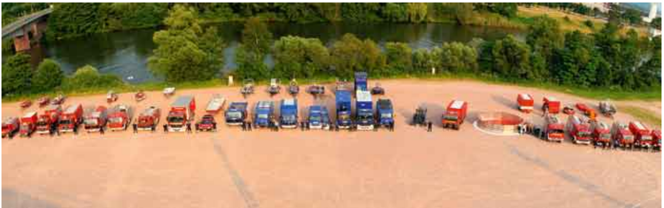
Ölwehrgüter des Landkreises Miltenberg