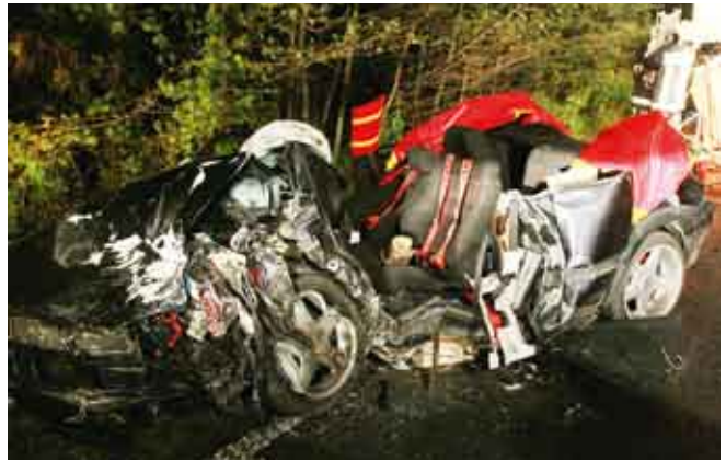
Verkehrsunfall B426 - Ortsausgang Eisenbach