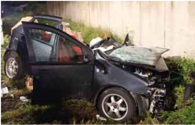
Verkehrsunfall B426 - Ortsausgang Eisenbach