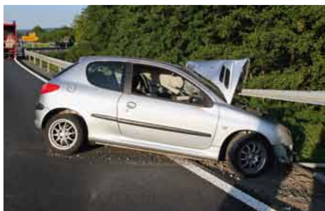
Verkehrsunfall auf B469 - Fahrtrichtung Mainhausen