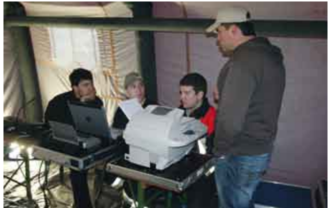
Übung Unterstützungsgruppe Örtlicher Einsatzleiter