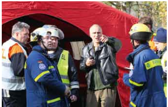
Groß-Übung im Hafen Erlenbach