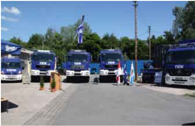
Fahrzeugweihe beim THW Oberburg