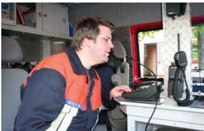
Stabsrahmenübung im Landratsamt