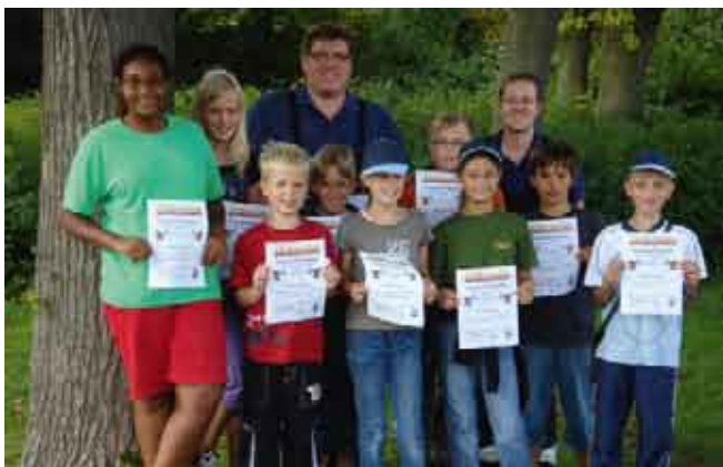
Ferienspiele in den Mainanlagen