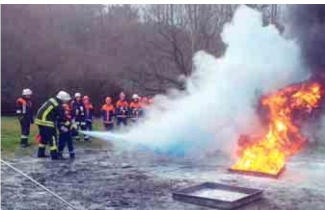
Übung Feuerlöscher zum Berufsfeuerwehrtag