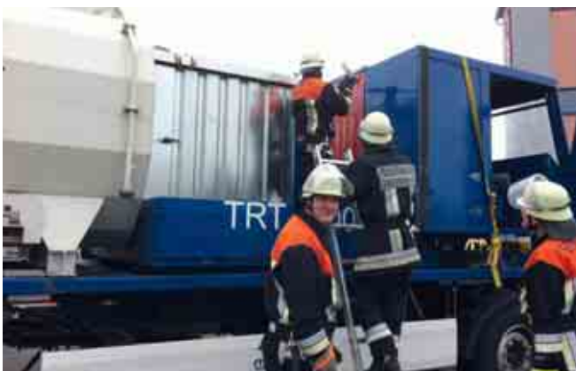
THL - Retten aus LKW