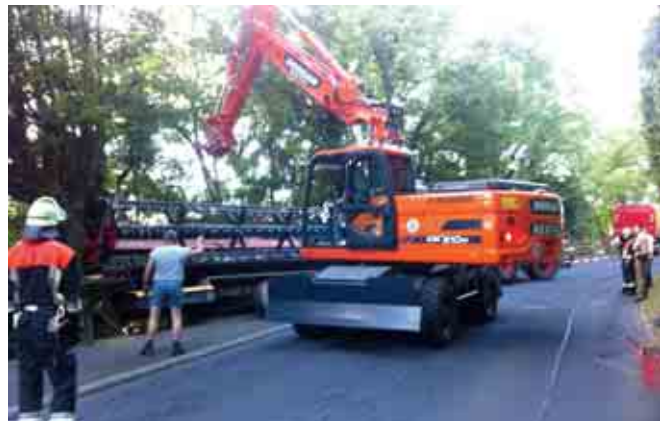
Verkehrsunfall mit Mähwerk