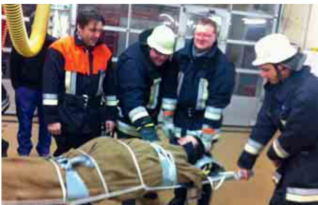
Übung der Aktiven