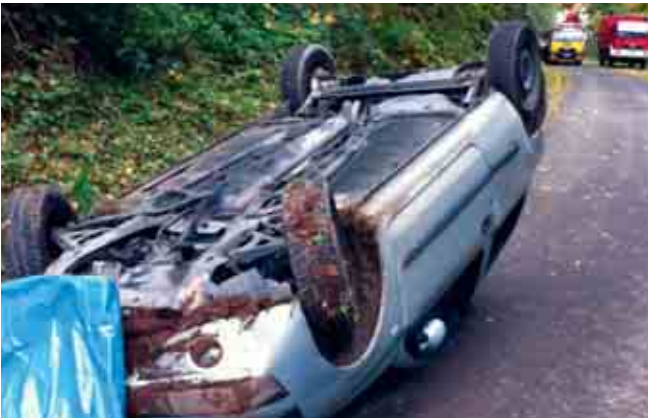
Verkehrsunfall Pflaumheimer Weg