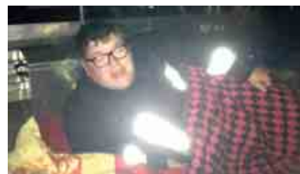
Der Jugendwart schlief auf Deck...

Anschließend verbrachten die Jugendgruppen noch einen geselligen Abend bevor alle schlafen gingen.