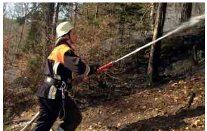
Waldbrand in Boxbrunn