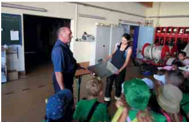
Besuch des Kindergartens