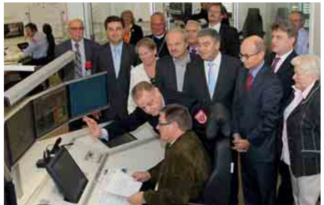
Einweihung der Integrierten Leitstelle Untermain