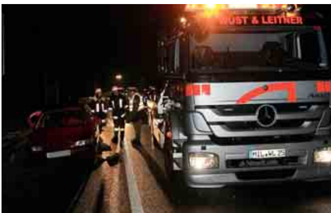
Verkehrsunfall auf der B469