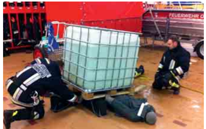
Übung KT THL