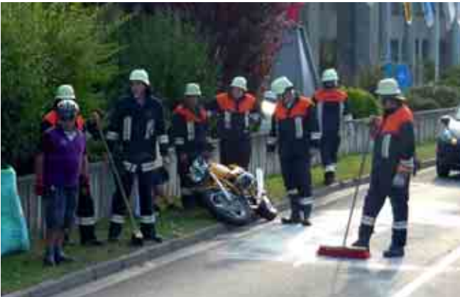
Verkehrsunfall auf B426