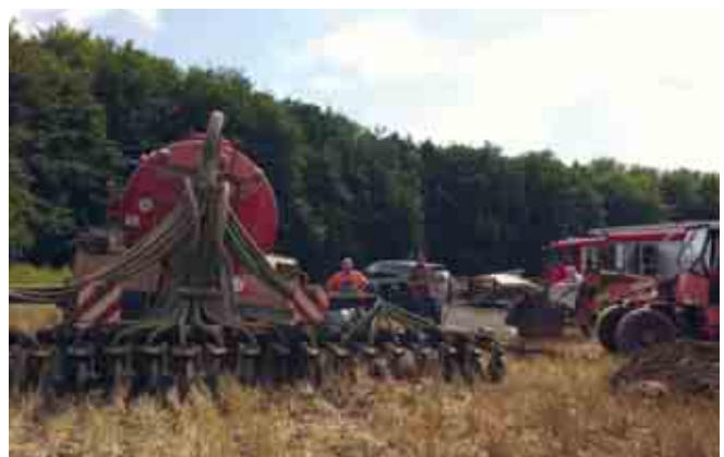
Einsatz THL an Güllefass