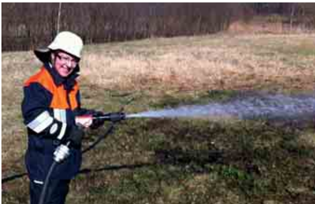
Flächenbrand am Mainufer