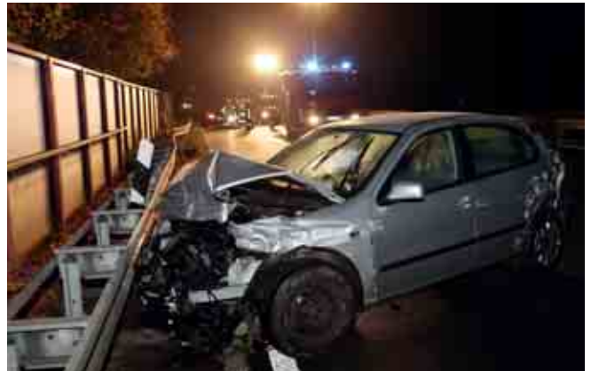
Verkehrsunfall auf B469