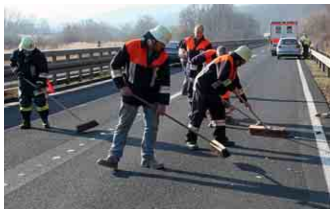
Verkehrsunfall auf B469