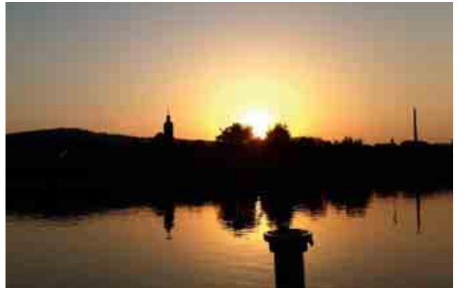
Bootsübung bei Sonnenuntergang