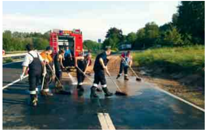
Unwettereinsatz auf B469