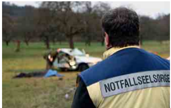
Verkehrsunfall auf B426