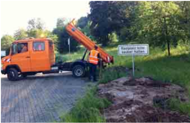
Parkplatzfrevler auf frischer Tat ertappt :-P