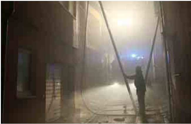
Brand in der Silvesternacht