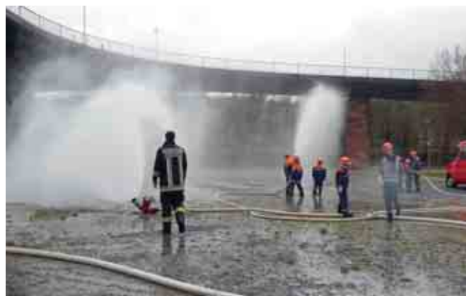
Einsatzübung zum Berufsfeuerwehrtag der Jugendgruppen